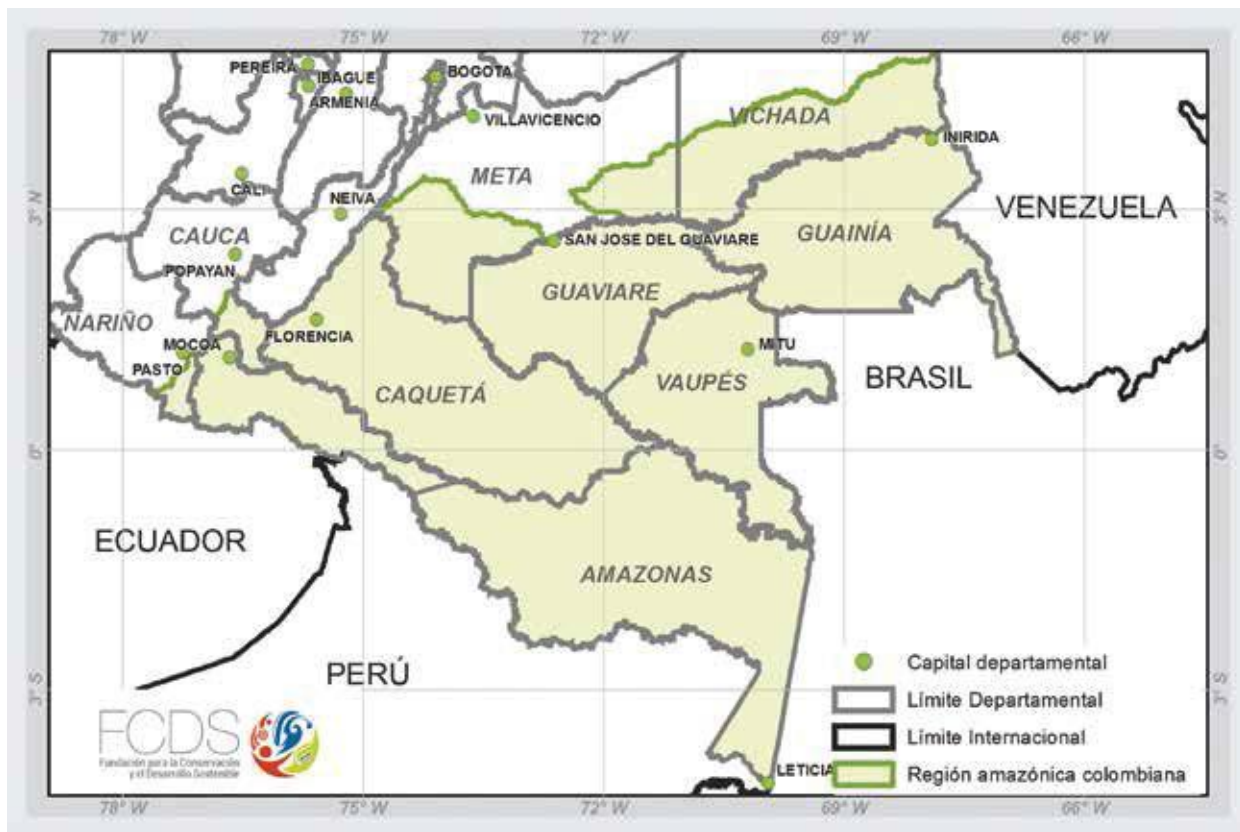
MAPA 1. REGIÓN AMAZÓNICA COLOMBIANA

En PND reconoce que las condiciones de competitividad de las regiones dependen no solamente de la existencia de un potencial productivo basado en su oferta ambiental, sino en la conectividad física para la movilización productiva. El componente de