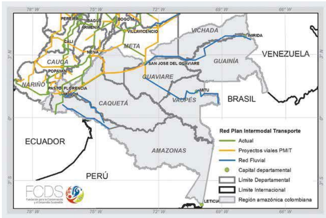
MAPA 3. PLAN INTERMODAL DE TRANSPORTE